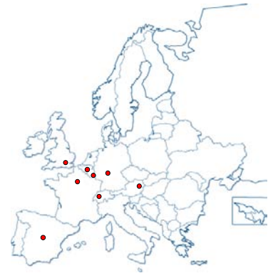
PSE: France, Suisse, Allemagne, Angleterre, Espagne, Belgique, Autriche, Luxembourg

Au cours des dernières années, PSE Luxembourg a mené une série d'actions de promotion et collecte de fonds: déjà 4 conférences en présence des fondateurs, depuis 2007. D'autres actions ont été menées dans des écoles luxembourgeoises en vue de sensibiliser les enfants.